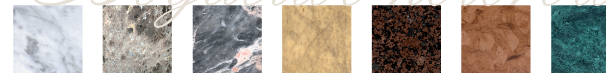
carrara maron emperador salome amarillo baltic balmoral tardosz verde guatemala